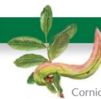
Cornicabra Pistacea terebinthus