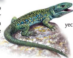
Lagarto ocelado Timon lepidus