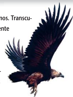
Buitre negro Aegypius monachus

Ruta para hacer a pie organizada con diversos tramos. Transcurre por distintos tipos de vegetación, principalmente de ribera, aunque no desmerece su riqueza paisajística o histórica desde lo alto de Cerro Gimio (panorámicas y restos de una atalaya romana). Desde Villarreal, el itinerario cuenta con varias alternativas en un recorrido de 7,5 km, cuya duración es aproximadamente de 2 horas y 30 minutos.