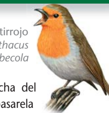
Petirrojo Erithacus rubecula