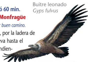
Buitre leonado Gyps fulvus