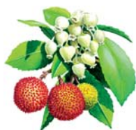
Madroño Arbutus unedo