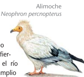
Alimoche Neophron percnopterus